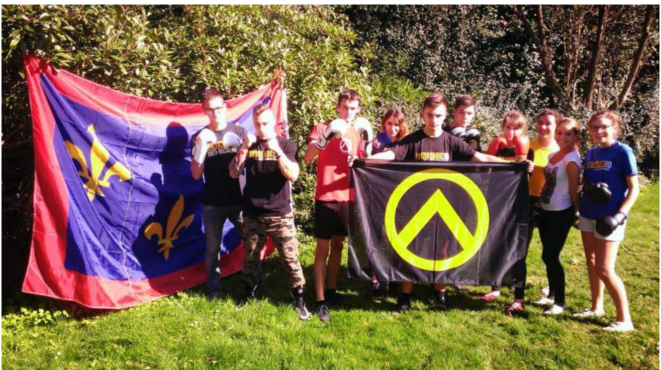
La version 2015 de cet entraînement au "self-defense"